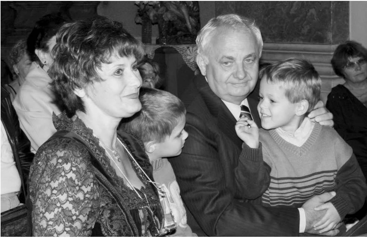
Ha a feleségem nem áll mellettem az elmúlt húsz évben ilyen következetesen, nem tudtam volna eljutni ide.