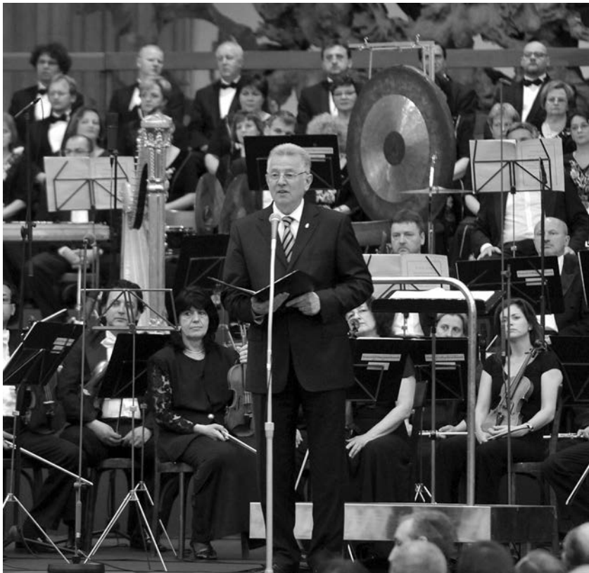
Schmitt Pál köszöntő beszédet mondott a hangverseny előtt a VI. Pátról elnevezett audienciateremben

„Nekünk, magyaroknak nagyszerű érzés, hogy miközben az európai figyelem soros uniós elnökségünkől adódóan hatványozottan irányul ránk, az UNESCO Liszt-éve jóvoltából a politikai nyelvezet mellé egy másik is társul: a zenéé” – mondta Schmitt Pál köztársasági elnök a Vatikánban, ahol a VI. Pátról elnevezett audienciateremben XVI. Benedek pápa tiszteletére május 27-én hangversenyt adott a Nemzeti Filharmonikus Zenekar és Énekkar.