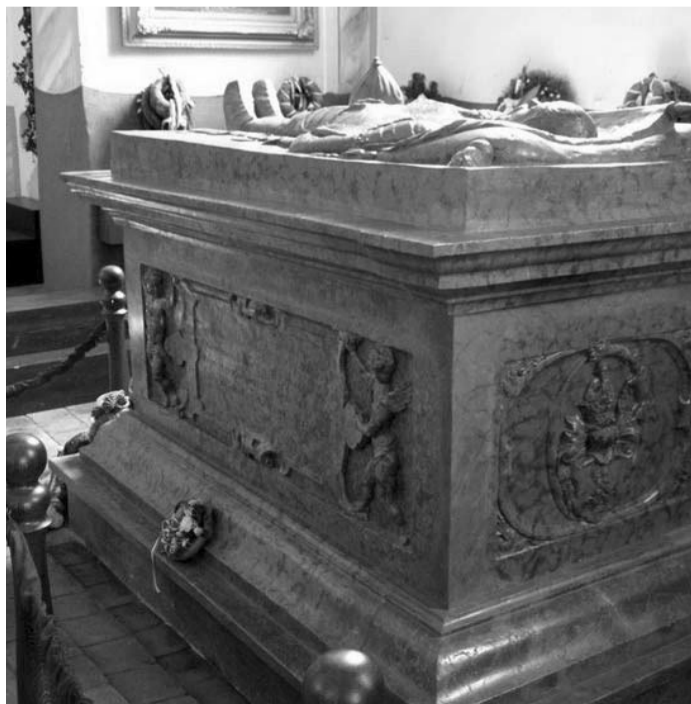
Dobó István sírja Dobóruszkán

A Nagymihályi járás magyar lakossága, az ott megvalósult régiós átszervezés miatt nincs könnyű helyzetben. Megtapasztalva azonban a helyi fiatalok lelkesedését, úgy gondoljuk, hogy ezt a mestersegesen felállított hátrány leküzdhető.