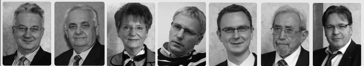
Semjén Zsolt Latorcai Miklós Hoffmann Rózsa Soltész Miklós Rétvári Bence Rubovszky György Vejkey Imre