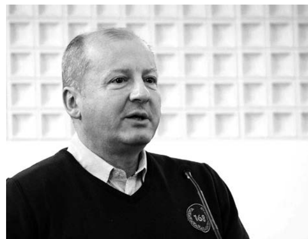
Simicskó István honvédelmi miniszter

Fontosak a hadiipari technikai fejlesztések, illetve a kapacitás bővítése is, minden területen. A katonai hiva-