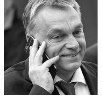
A képek illusztrációk

Szijjártó Péter később újabb részleteket árult el az Orbán-Trump-beszélgetéssel kapcsolatban. „Donald Trump Orbán Viktorral folytatott telefonbeszélgetése során köszönetét fejezte ki az amerikai magyarok támogatásáért, és elmondta azt is, hogy mindig is nagy tisztelője volt Magyarországnak” – fogalmazott a külügyminiszter. Donald Trump azzal kezdte a beszélgetést, hogy megköszönte Orbán Viktornak az amerikai magyar közösség támogatását. Jelezte, nagyon sokat jelentett számára, hogy az amerikai magyarok nagy számban álltak mellé és ennek komoly jelentősége volt a győzelmében is. „I’m a big fan of Hungary” – a megválasztott amerikai elnök szó szerint így fejezte ki, hogy mindig is nagy tisztelője volt Magyarországnak. A külügyminiszter hozzátette: Donald Trump elmondta azt is, hogy respektálja a magyar miniszterelnök, Magyarország és a magyar gazdaság teljesítményét, valamint arról is beszélt, hogy izgalmas idők jönnek most a világban, ezért érdek-