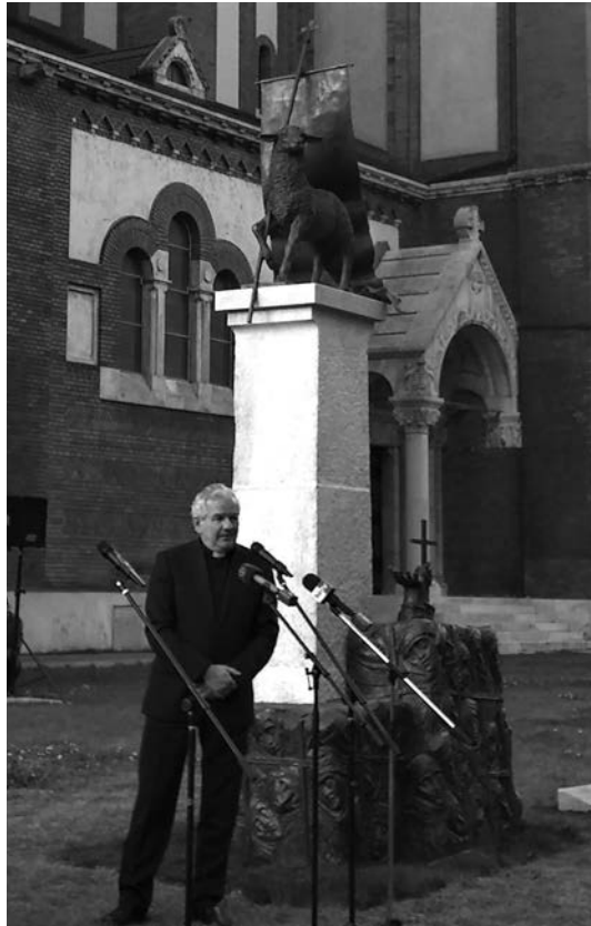
Kiss-Rigó László katolikus megyéspüspök a Gulág áldozatainak állított emlékmű előtt

Ha képzeletben egymás mögé raknánk azokat a marhavagonokat, amelyekben 800 ezer honfitársunkat vitték el Magyarországról csaknem ezer Gulág rabtelepre, hogy ott kényszer munkát végezzenek, akkor az eleje Debrecennél lenne, a vége pedig Székesfehérvárnál. Ez a képzeletbeli szerelvény olyan hosszú, hogy még az úrból sem lehetne eltéveszteni – hangsúlyozta a miniszterhelyettes. A vagonok tele voltak megnyomorított sorsokkal, reménytelenséggel, bizonytalansággal, igazságtalansággal, olyan emberekkel, akik