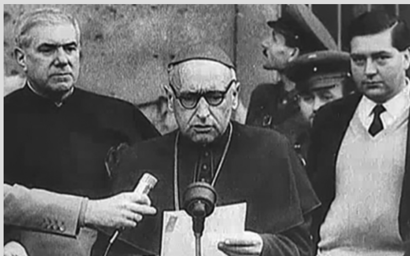
Mindszenty József 1956-ban

November 4.-e után a DNP. vezetői folytatták tevékenységüket, szoros kapcsolatot tartottak fenn a szociáldemokratákon keresztül a többi koalíciós párttal. Tudomásuk volt az indiai követnek átadott memorandumról. Matheovits több ízben járt Révész Andrásnál is ezekben a hónapokban. Szoros barátságot tartott ugyanakkor Ármos Istvánnal, akinek közismerten jó kapcsolata van az angol követséggel. November 11.-én például Ármosné lakásán találkozott Farkas Dénes, Matheovits Ferenc és Székely Imre Kálmán, akik itt megbeszélést tartottak, majd mentek együtt el más pártbeli vezetőkkel tárgyalni.”