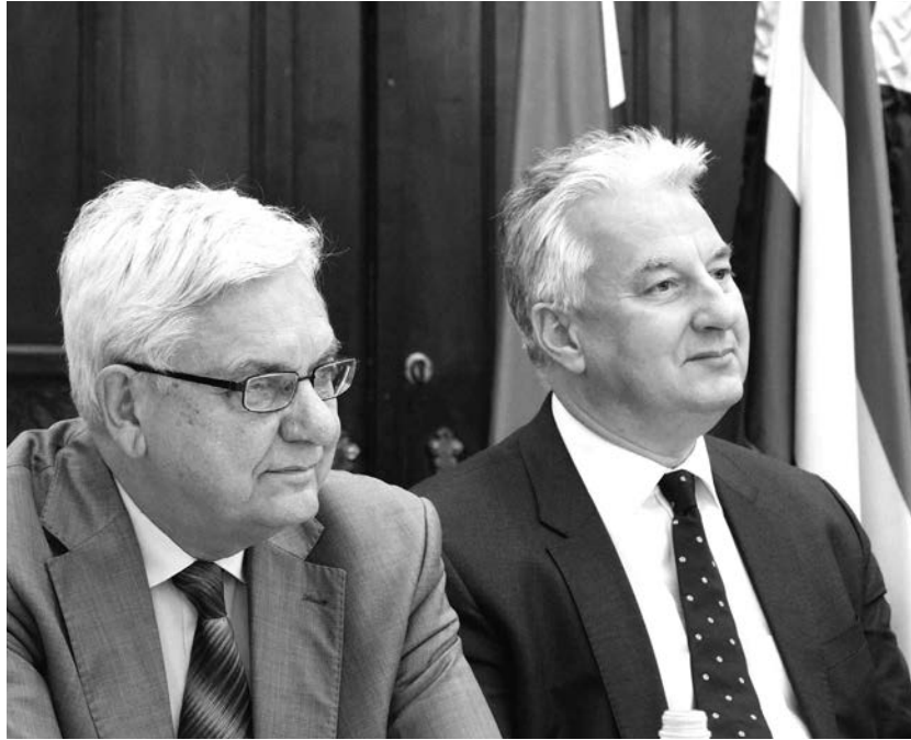
Duray Miklós és Semjén Zsolt az író Rendszerváltozás, rendszerváltoztatás, rendszerváltás a Kárpát-medencében 1963-2015 című könyvének bemutatóján 2016 novemberében

Németh Zsolt egyetemi évei alatt a Közgazdasági Egyetem Rajk Kollégiumában vezetett és szervezett telt házzal működő klubot, míg Lezsák Sándor aktívan tevékenykedett a Fital Írók József Attila Körében, és a „Lakiteleki sátor” résztvevőinek jelentős része került ki a már működő