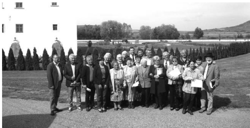
A KDNP Protestáns Műhelyének tagjai Golopon

A KDNP miskolci szervezetéről szóló beszámolót a Házánk 2017. februári számában olvashatják.