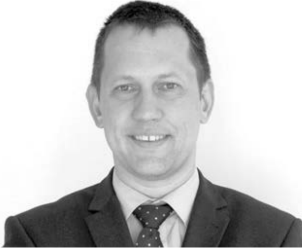
Fülöp Attila (KDNP) szociális ügyekért felelős államtitkár

Nemcsak segítség, hanem ésszerű gazdasági döntés is a megváltozott munkaképességű emberek foglalkoztatása – közölte az Emberi Erőforrások Minisztériumának (EMMI) szociális ügyekért felelős államtitkára a közelmúltban Budapesten.