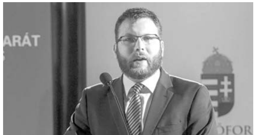
Schanda Tamás (KDNP) európai uniós fejlesztésekért felelős államtitkár

Az államtitkár az Európai Bizottság (EB) – egy éve bemutatott, a 2021 és 2027 közötti időszakra vonatkozó – uniós költségvetési tervéről elmondta: abban az olyan jól működő programokra, mint a kohéziós és a közös agrárpolitika, kevesebb forrás jutna, az EB által közvetlenül kezelt programokra