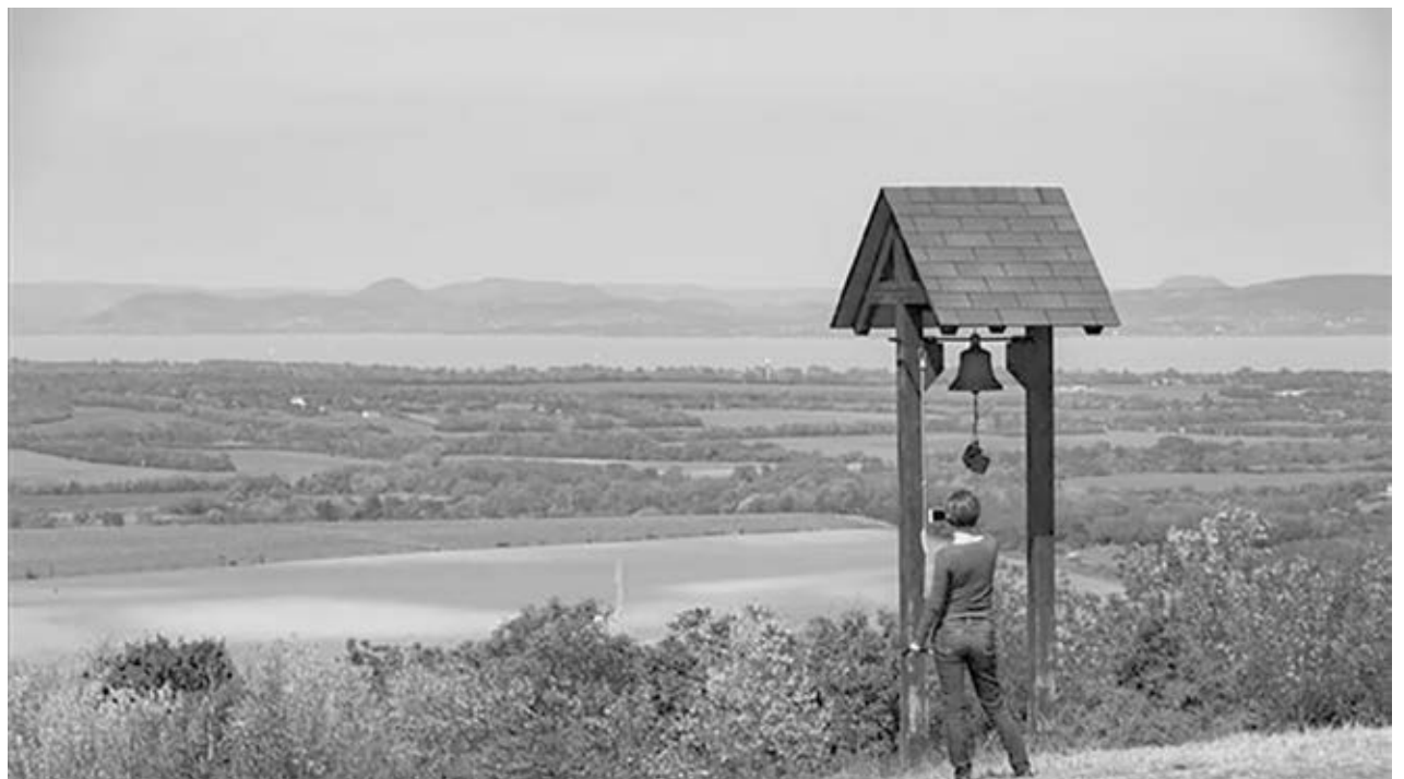
A kápolna haranglába, háttérben a Balaton

Az Országgyűlés alelnöke, a KDNP Országos Választmányának elnöke a Szőlád közeli, Neзде-hegyi erdei kápolna avatásán mondta el fenti beszédét 2019. május 25-én