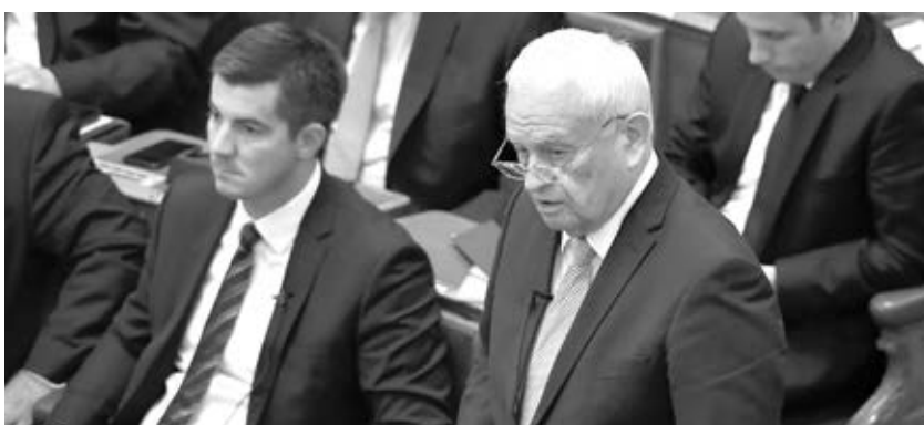
Semjén Zsolt miniszterelnök-helyettes, a KDNP és Orbán Viktor miniszterelnök, a Fidesz elnöke (a felső képen), illetve Kocsis Máté (balra), a Fidesz és Harrach Péter, a KDNP frakcióvezetője