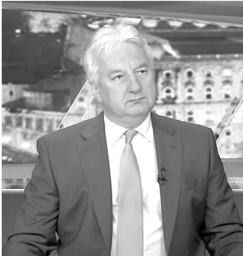
Semjén Zsolt: Hűségesnek kell lennünk a keresztény örökséghez

– Természetesen. A Kereszténydemokrata Néppárt ezt a programot képviseli 1944 óta. Volt, hogy a nyilasokkal szemben, volt, hogy a kom-