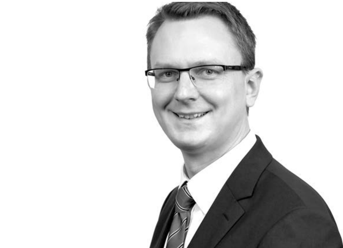
Rétvári Bence, az EMMI miniszterhelyettese, a KDNP alelnöke

– Amikor a bevándorlás veszélyeiről beszélünk, a biztonságunk mellett leginkább a keresztény kultúra védelme szokott még elő-