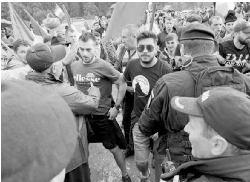
Román szélsőségesek „megrohamozták” és „elfoglalták” a temetőt

Az RMDSZ és a magyar Külügyminisztérium is elítélte az erőszakos román provokációt.