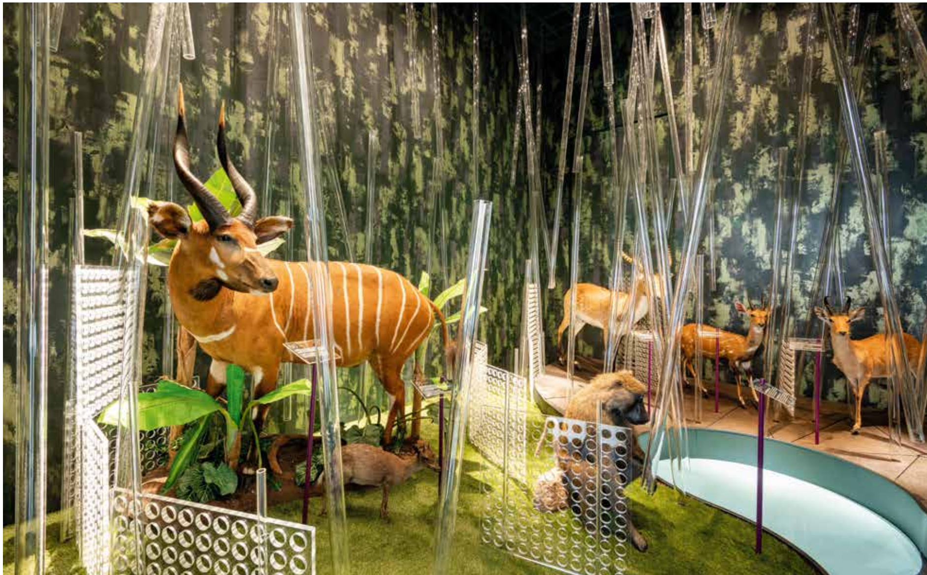
Zolt Vasáros: Džungla