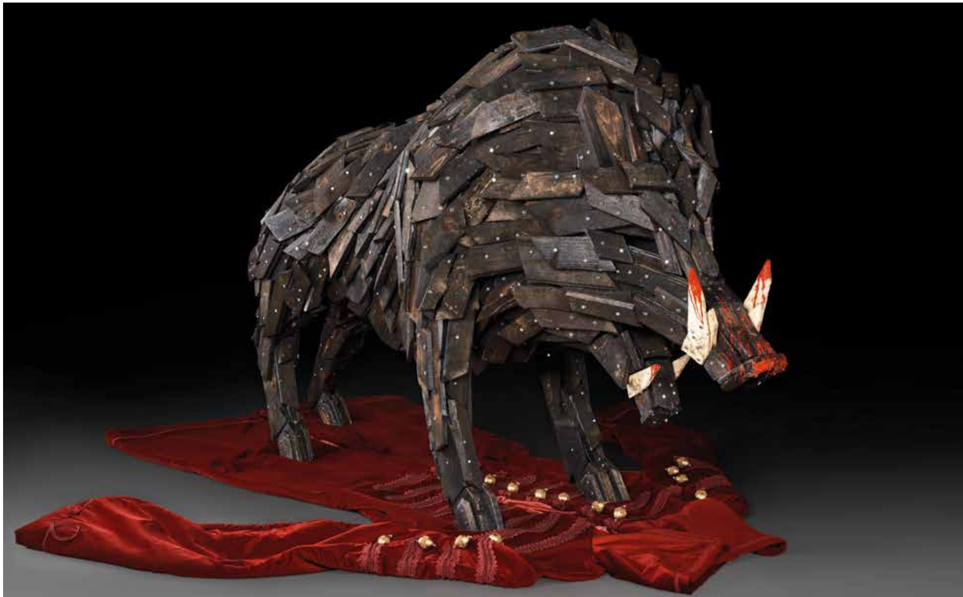
Gábor Szőke Miklós: Zrínyiho smrt