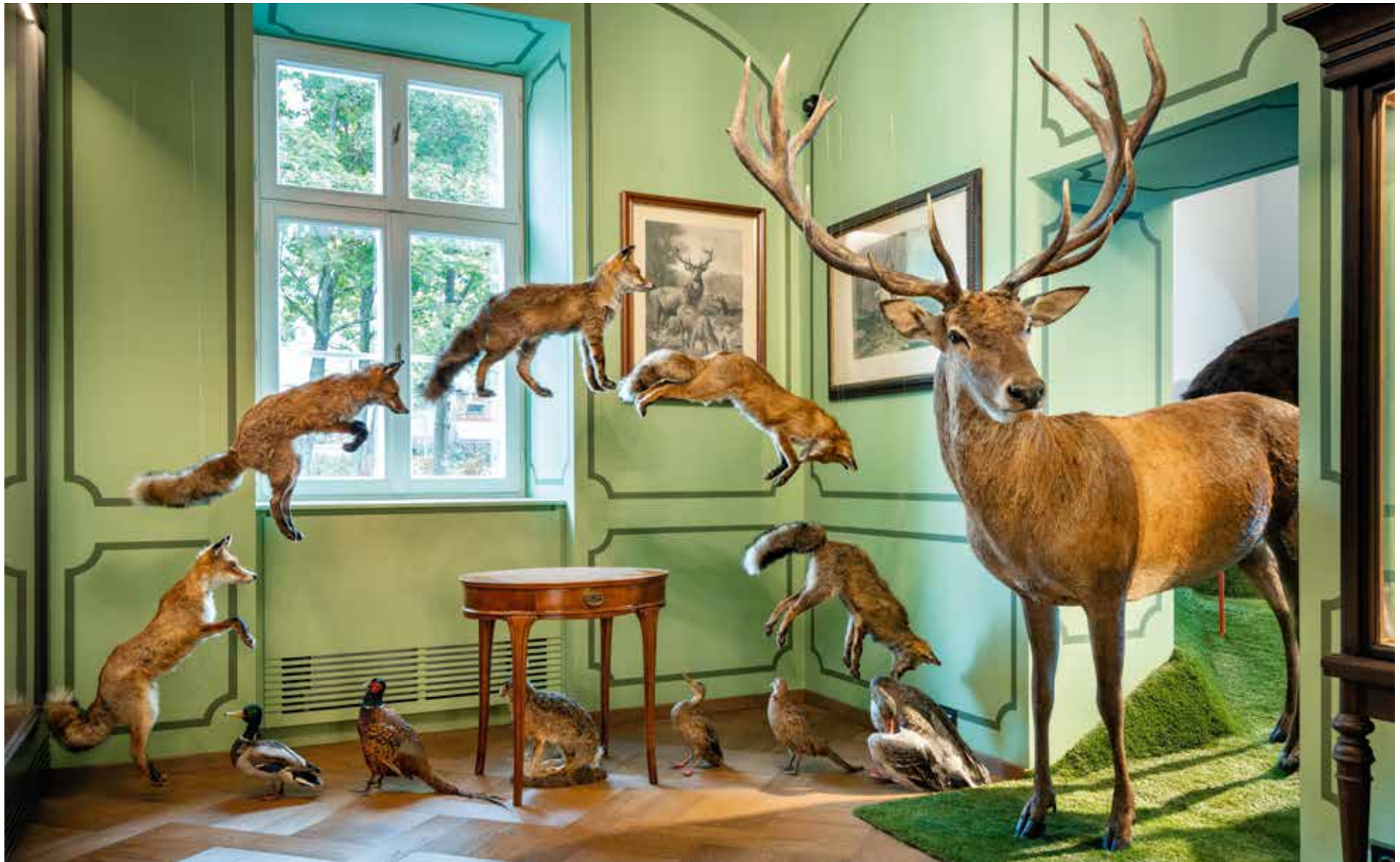
Zsolt Vasáros: Poľovnícka izba