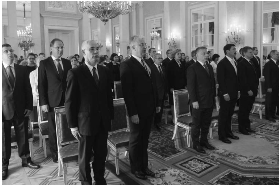
A kormány tagjai átvették megbízásukat Áder János köztársasági elnöktől

Ez a kormány az egész magyar nemzetet képviseli – utalt arra, hogy a határon túli magyarok is szavazhattak az országgyűlési választáson. Hozzáfűzte: elvárható a kormány minden tagjától, hogy vállalja ezt a történelmi felelősséget, és mindig álljon ki a ma-