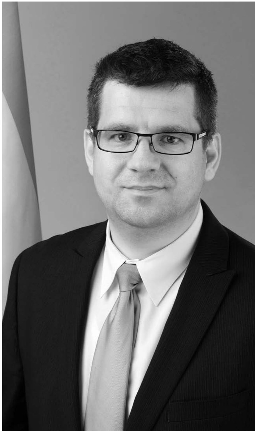
Seszták Miklós nemzeti fejlesztési miniszter

– Mit tart miniszteri tevékenysége legfontosabb eredményének, és melyek a következő 2 év legfőbb kihívásai?