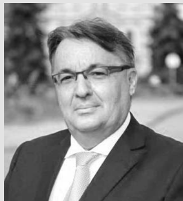
Leleszi Tibor kisvárdai polgármester

– Hiszem, hogy csak hittel és odaadással érhető el az a polgári elégedettség, mely városunkban érzékelhető és megfigyelhető az utóbbi években. Ahhoz, hogy a harmónia és a segítő együttműködés kialakulhasson és beépüljön mindennapjainkba, szükséges az egyházak közreműködése. Mind a város vezetésének koncepciójában, mind pedig Kisvárdára kulturális életében vagy épp a jótékonysággal egybekötött rendezvényeink életre hívásában is kiemelkedő jelentősége van az egyházaknak és egyházi kezdeményezéseknek. Erősítjük és támogatjuk testvérvárosi kapcsolatunkat is azáltal, hogy a határon túli egyházaknak segítő kez-