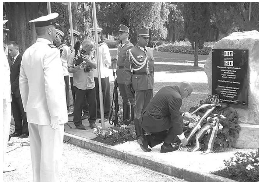
Az emlékmű, amely a magyar haditengerészek helytállása előtt tiszteleg