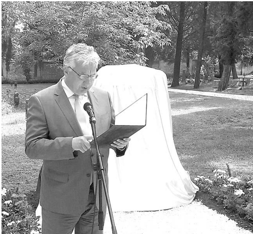
Semjén Zsolt avatóbeszéde

Okvetlenül említeni kell néhány nevet a Monarchia magyar tengerészparancsnokai közül. Thierry Ferenc sorhajókapitány, az új tengeralattjáró fegyvernem kiválósága, Mikuleczky Ferenc fregattkapitány, és a legnagyobb magyar