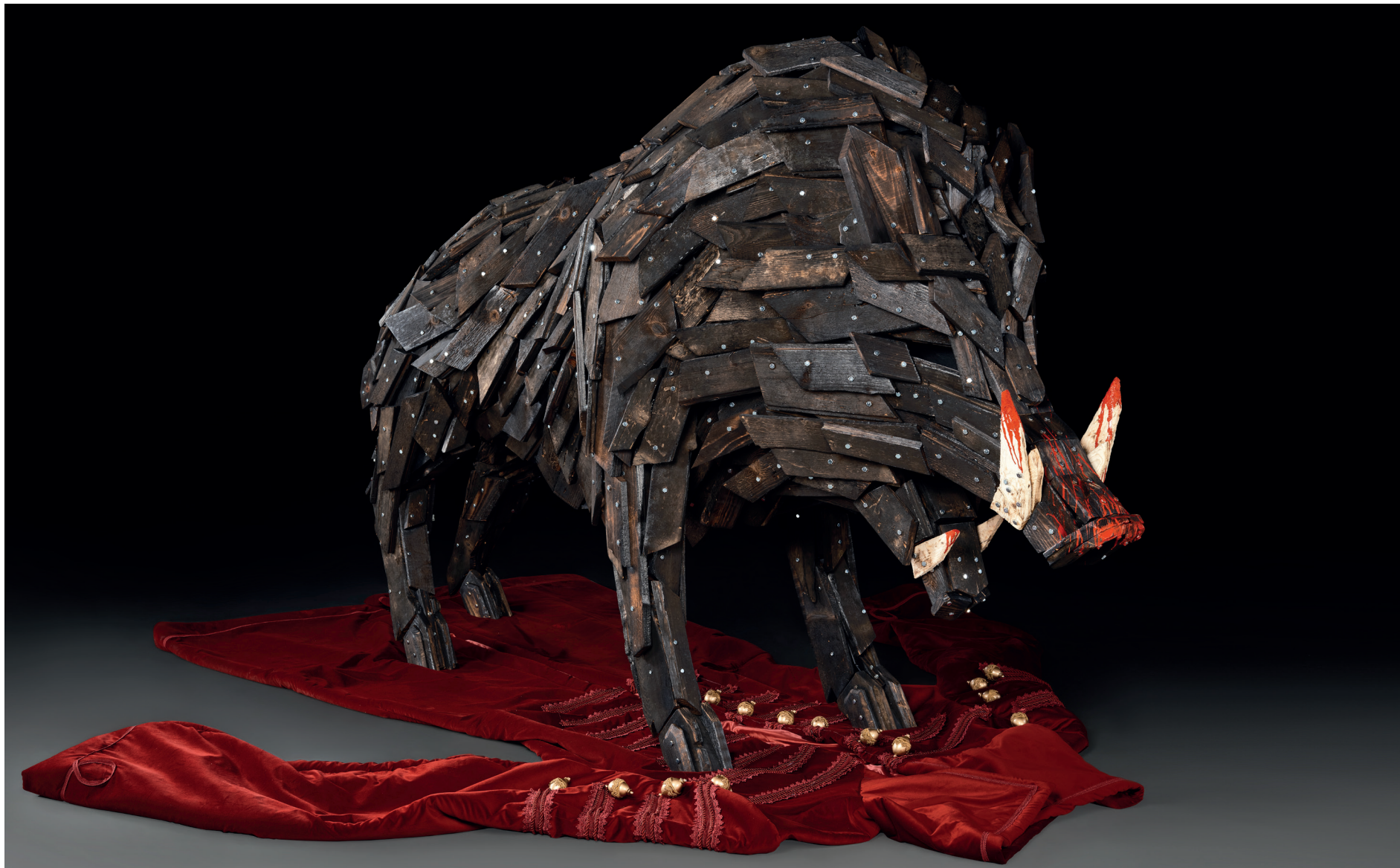
Gábor Miklós Szóke: La morte di Zrínyi