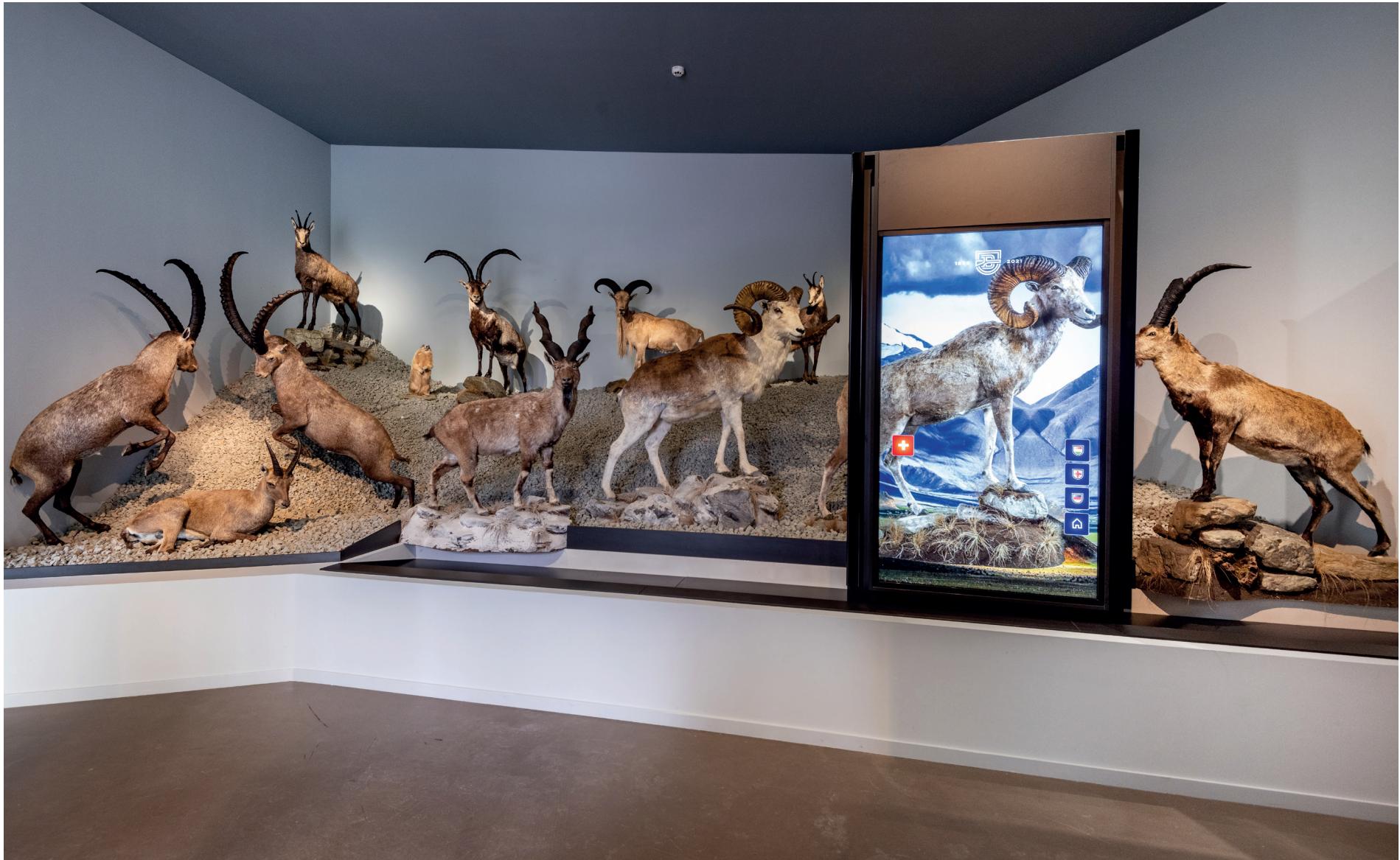
Zsolt Vasáros: Alta montagna