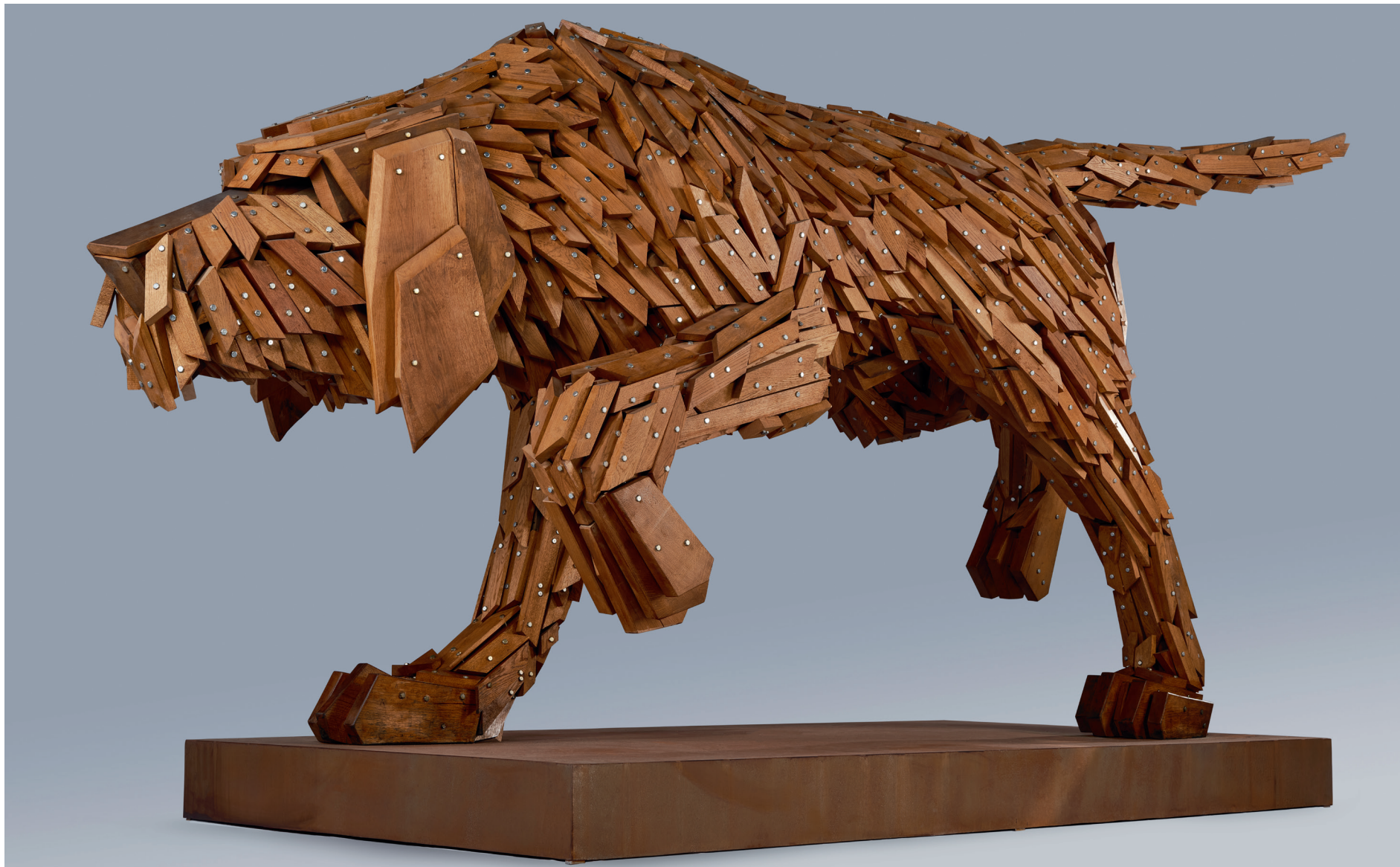
Gábor Miklós Szóke: Bracco ungherese