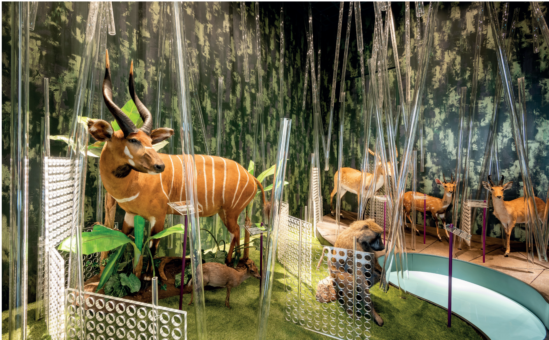
Vasáros Zsolt: Giungla