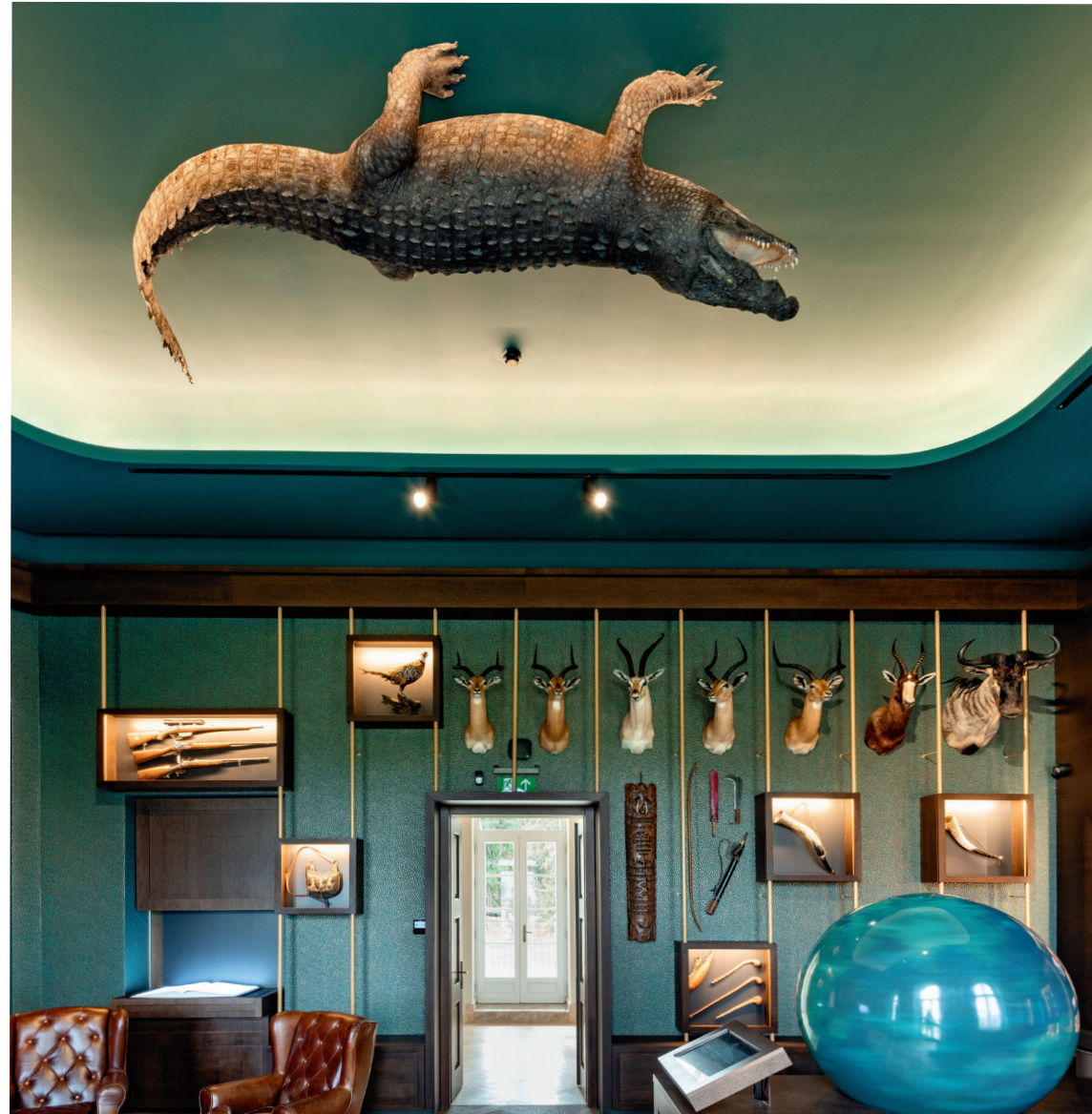
Zsolt Vasáros: Sala dei sigari