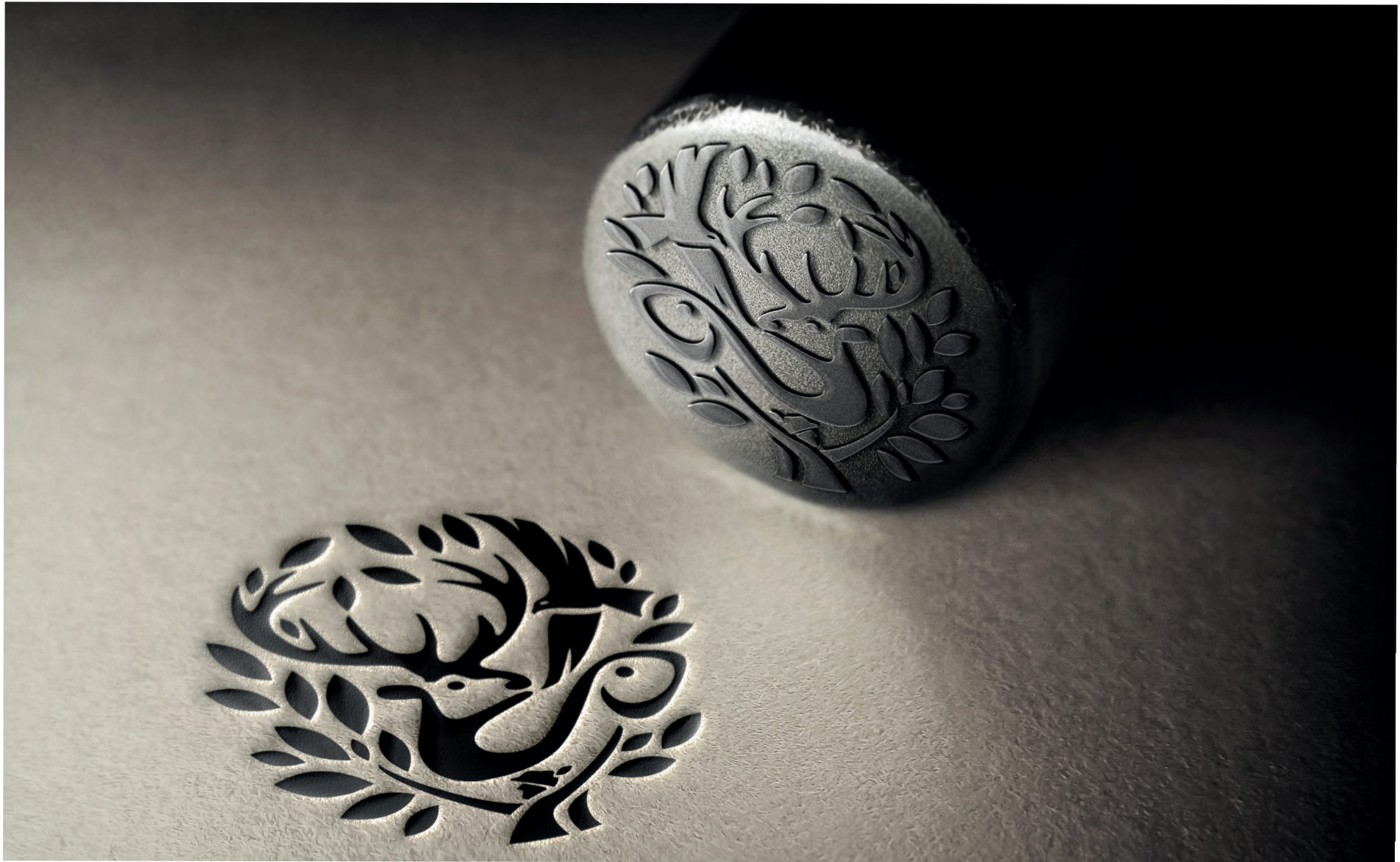
Tutt'uno con la Natura