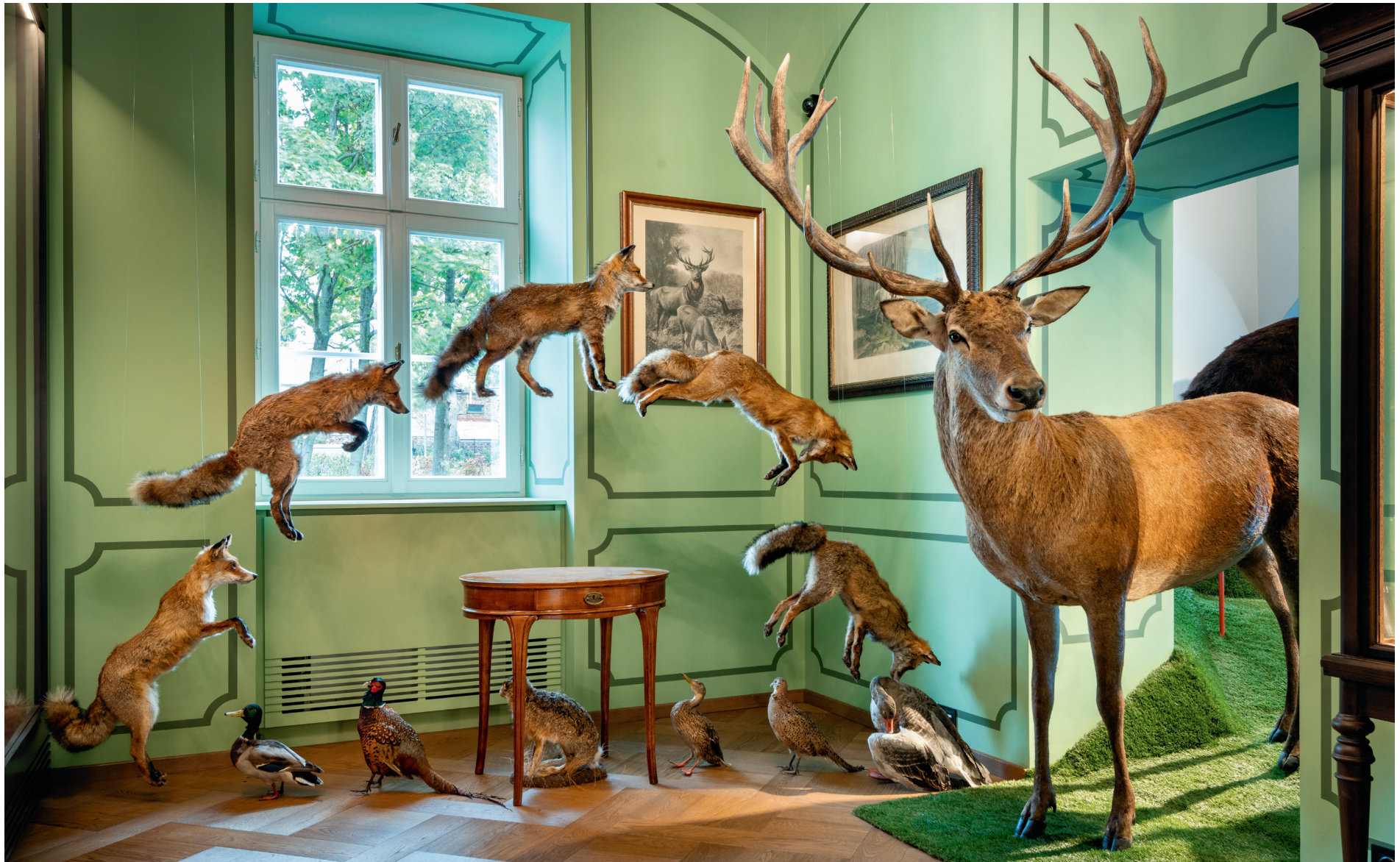
Zolt Vasáros: Stanza da caccia