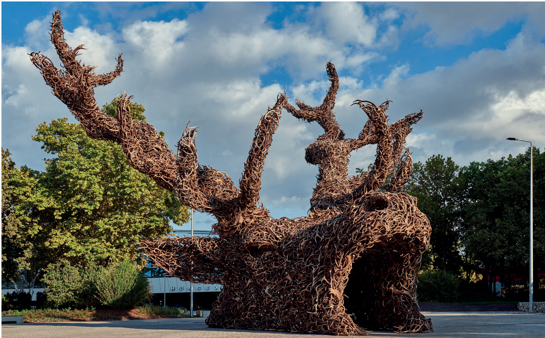
Gábor Miklós Szóke: Totem La porta di benvenuto dell'Esposizione Mondiale della Caccia, realizzata con 10 tonnellate di corna di cervo donate da 70.000 cacciatori ungheresi come simbolo di solidarietà dei cacciatori ungheresi