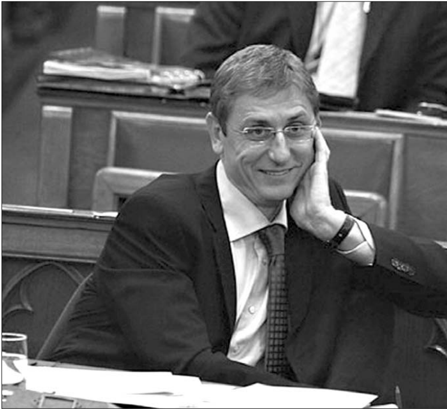
A kormányfő vitatta Orbán Viktor szavait

Gyurcsány Ferenc a Fidesz elnökének felszólalására reagálva elmondta, hogy az 1998-as Orbán Viktor sokkal szimpatikusabb volt számára, mint a 2008-as. „Amit képvisel, azzal van a vitám, nem a személyével” – tette hozzá. Az őszi beszéd kapcsán leszögezte, hogy az, aki bizonyos elemeket kiemel a beszédéből, hibázik.