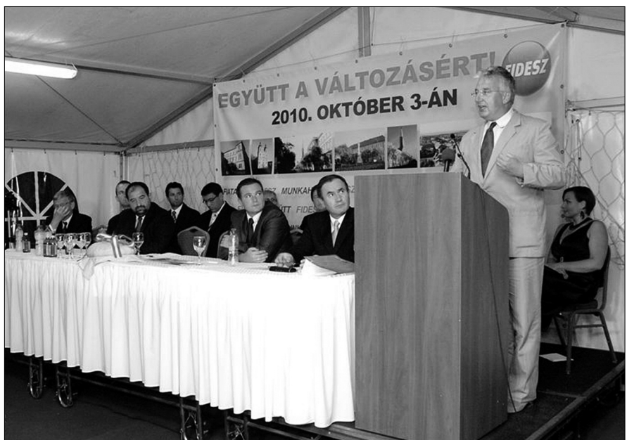
2010. augusztus 19. – Kampánynyitó Kalocsán

Nemesnádudvaron az Új Magyarország Vidékfejlesztési Program keretében 25 millió forintból újult meg a főter. Azzal egyidejűleg átadták azt a tíz felújított utcát is, amely az Európai Unió támogatásával, az Európai Fejlesztési Alap társfinanszírozásával 200 millió forintos költségvetésből készült el.