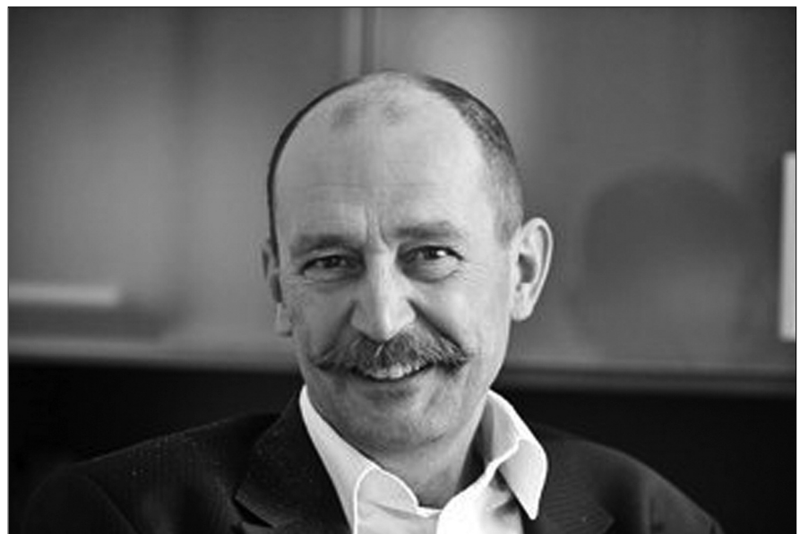
Mészáros József, az Országos Nyugdíjbiztosítási Főigazgatóság főigazgatója

Mészáros József , az Országos Nyugdíjbiztosítási Főigazgatóság főigazgatója: – Azon a helyen, ahol én dolgozom, ott a