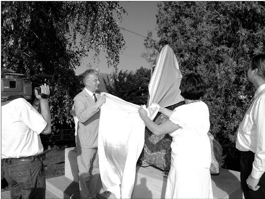
2010. augusztus 19. – Szoboravató Bátyán

A magyar nemzet mindig akkor gazdagodott lelkieben, szellemiekben és anyagiakban is, amikor hűséges volt Szent István örökségéhez – mondta Semjén Zsolt miniszterelnök-helyettes a Bács-Kiskun megyei Nemesnádudvaron. A KDNP elnöke hangsúlyozta, hogy Szent István műve ma is él. Példaként említette a kalocsai érsekséget, a templomépítéseket és a ma is fennálló megyerendszert. Emlékeztetett arra, hogy a kommunista propaganda megpróbálta meghamisítani Szent István ünnepét és az 1949-es Alkotmány ünnepévé változtatni, de ez nem sikerült, mert a nagy király műve a mai napig is él az emberek szívében.