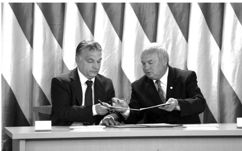
Orbán Viktor miniszterelnök és Dénes Sándor, Nagykanizsa polgármestere a Modern Városok Program keretében együttműködési megállapodást írt alá Nagykanizsán

Két nagyon lényeges elvnek kívánunk megfelelni a város jövője érdekében: az első, hogy biztos talajon kell állnunk, amely a hagyomány tisztelgésén alapul. Keresztény őseink által felépített otthonunk értékeit fontos megőriznünk a jövő generációi számára, hogy harmonikusan fejlőd-hessünk, de az idősebbek is érezzék munkájuk megbecsülését. A második szempont, hogy mindig a megújulás, az innováció formáit keressük, így teremtve lehetőségeket a fiataloknak is a városunkban. E két szempont, úgy gondolom, a kereszténydemokrata gondolkodásnak is sarokkövei, hiszen keresztény ünnepeink is ezt az irányutat adják számunkra. Őrizni a hitet, emlékezni Jézus születésére, a Feltámadásra, minden évben jelenként megélni a múltat, a jövőre is tekintettel. Ezt az elvet próbáljuk Nagykanizsán a mindennapok gyakorlatában megvalósítani. Kiváló kapcsolatokat ápolunk a történelmi egyházakkal, minden rendezvényünkön jelen vannak képviselőik, az áldásukat kérjük megújuló építményeinkre, szobrainkra, közösen ünnepeljük az Advent időszakát, a Pünkösödöt, ugyanakkor a fejlődésért együttműködünk számos pályázatban. Természetes számunkra, hogy a hit manifesztumait gondosan megőrizzük, így az elmúlt években a fogadalmi kökeresztjeinket és a templomainkat is felújítottuk.