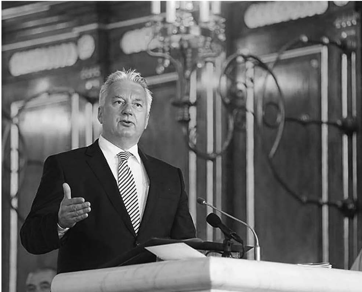
Semjén Zsolt miniszterelnök-helyettes a nagyváradai székesegyházban mondta el beszédét

Prohászka Ottokár zseniális meglátása, hogy az egyetemes kereszténység benne lett sajátosan magyarrá. Szent István vasakarata és apostoli buzgalma megkeresztelte a magyar embereket, de ez még nem tette kereszténnyé a magyar nemzetet. A keresztényi szentség és a magyar szellem Szent Lászlóban egyesült. Az Anyaszentegyház példaként állította a mindenkori magyar királyok elé, végső soron élénk is, és ebben az összefüggésben megkockáztatom, hogy azért lett keresztény szent, mert magyar hős volt, és azért lett magyar hős, mert keresztény szent volt. A lovagkirály. Akiben egyesült a nomád vitéz ősi öröksége – Szép Mező Szárnyától, Hunoron és Magoron át, Attiláig – a keresztény hitvalló aszkétával. A pusztai harcos a kereszteslovaggal.