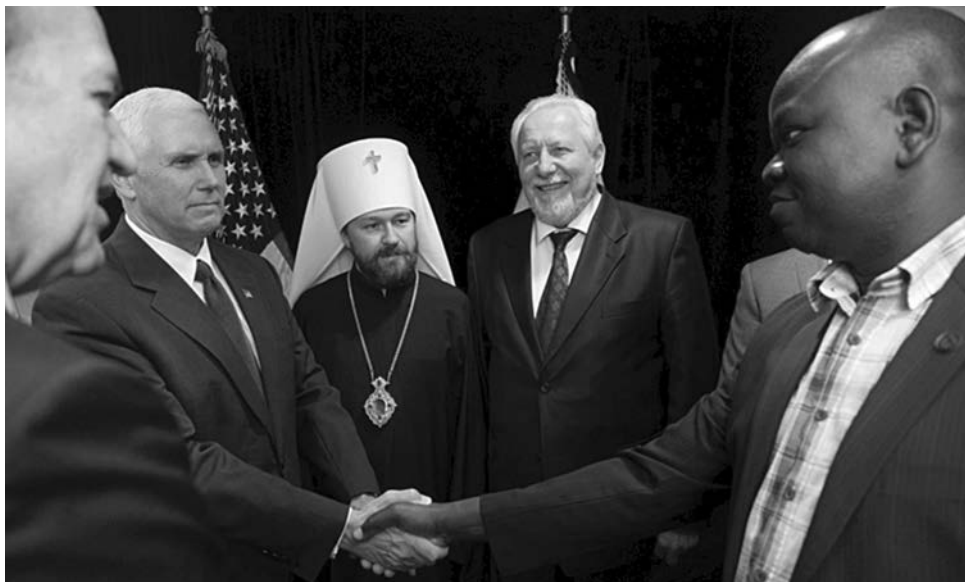
Mike Pence, az USA alelnöke (balról a második) is felszólalt az ökumenikus világtalálkozón