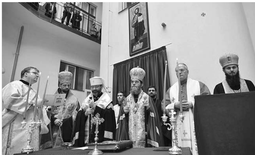
Az ünnepségen számos egyházi vezető részt vett

Kocsis Fülöp érsek-metropolita köszönetet mondott a magyar kormányoknak, amely összesen 2,3 milliárd forinttal támogatta a metropólia Debrecenbe települését, és a városnak, amiért épületeket biztosított az elhelyezésükhöz.