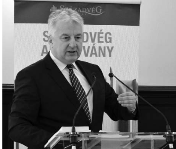
Semjén Zsolt: „Az autonómia követeléseket sohasem szabad feladni”

Ez különösen a parlamenti választásokon fontos – folytatta Semjén Zsolt, aki szerint nem engedhető meg, hogy olyan konstrukciók induljanak, amelyeknek nincs reális esélyük a parlamentbe való bekerülésre, csak néhány szavazatot elvisznek. Megjegyezte: helyes, hogy a külhoni magyar pártok részei az európai pártcsaládoknak, de egy határon túli magyar párttól olyan „ideológiai ortodoxia” nem várható el, mint egy magyarországi tömörüléstől.