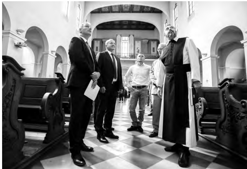
Soltész Miklós, az Emberi Erőforrások Minisztériumának egyházi, nemzetiségi és civil társadalmi kapcsolatokért felelős államtitkára, a KDNP alelnöke; Simicskó István honvédelmi miniszter, Újbuda országgyűlési képviselője, a KDNP alelnöke; Molnár László alpolgármester, Gyorgyevics Miklós önkormányzati képviselő és Szkaliczki Csaba Őrs plébános a budai ciszterci Szent Imre-templomban

Kitért arra: a templom homlokzata, a lépcső és az erkély is felújításra szorul. Emellett a támogatásból megtörténhet a templom belsejének festése, műsza-