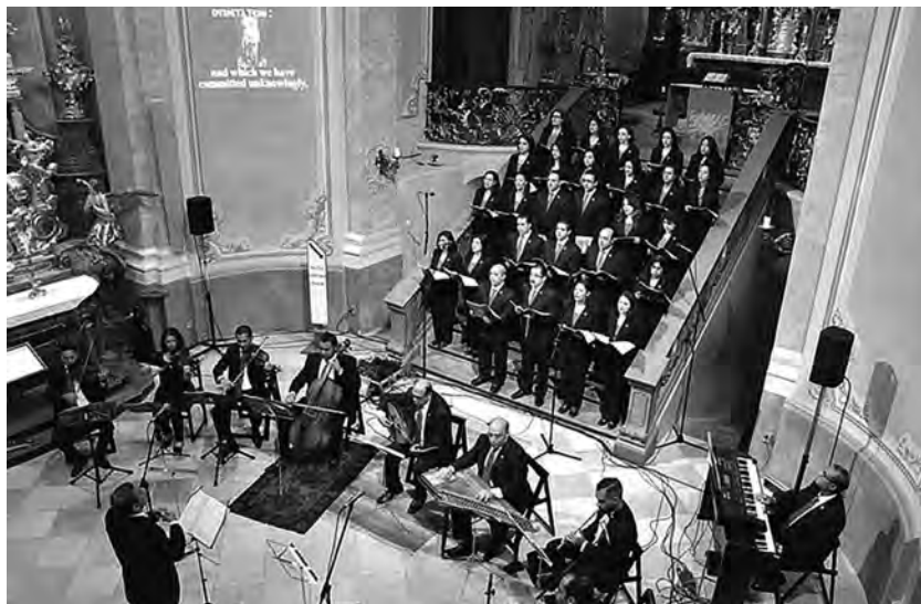
A kórus szeptember 1-jén a tihanyi bencés apátságban lépett fel