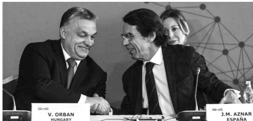
Orbán Viktor José María Aznar volt spanyol kormányfővel a konferencián