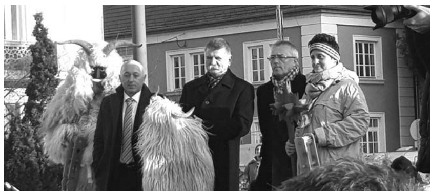
Kövé László, az Országgyűlés elnöke (középen) és Hargitai János, Mohács kereszténydemokrata parlamenti képviselője (jobbról a második) is a busójárás vendége volt

öltve tértek vissza a folyón átkelve és rajtaütöttek a babonás törökökön, akik az ijesztő maskarasoktól megrémülve fejvesztve menekültek a városból. Ezt a hagyományt elevenítik fel minden évben a busók dunai átkelésével.