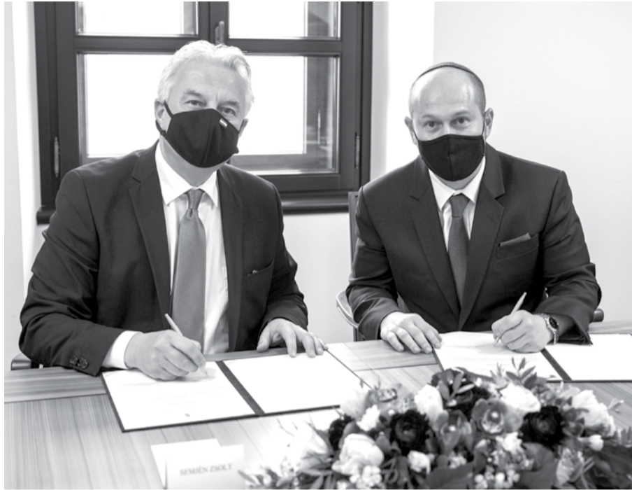
Semjén Zsolt miniszterelnök-helyettes, a KDNP elnöke és Róna Tamás főrabbi, a Zsima elnöke

Semjén Zsolt az új támogatási formára utalva azt hangsúlyozta, hogy az senkit sem érint hátrányosan. Emlé-