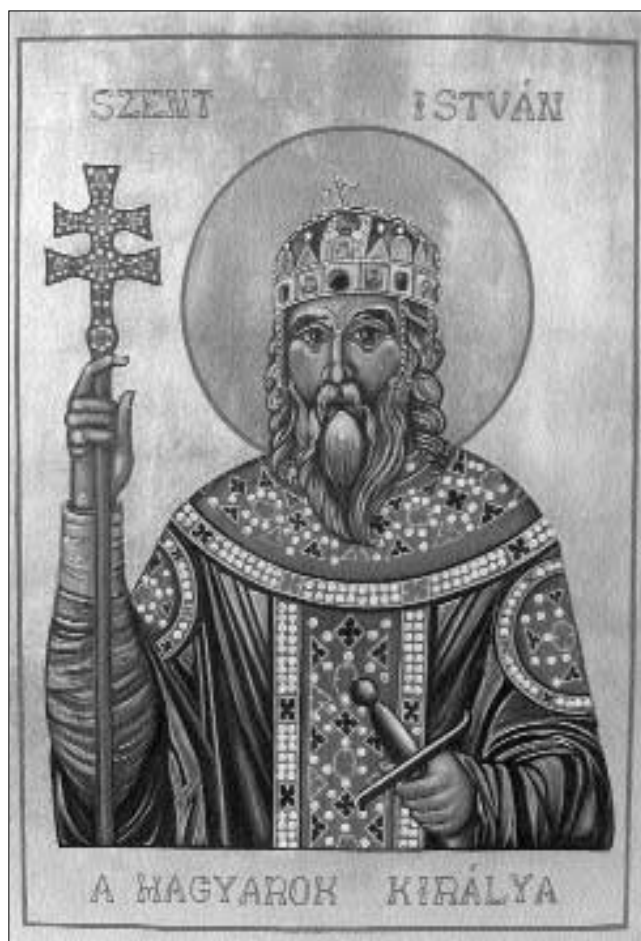
Latorcainé Ujházi Aranka ikonja államalapítónkról