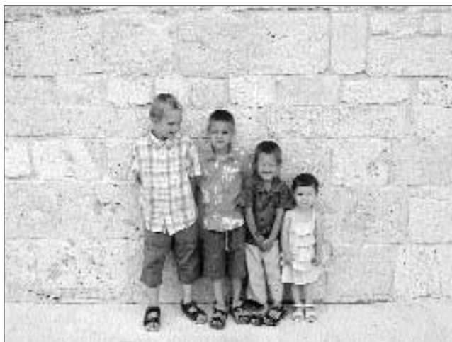
A jövő záloga