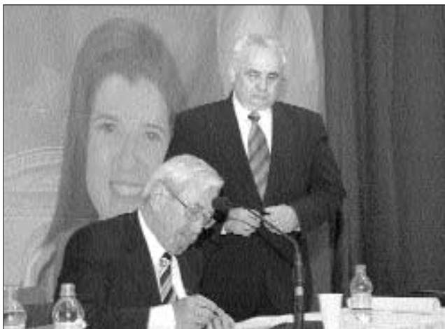
Szolgálatunk része a pártvezetésben vállalt tevékenység