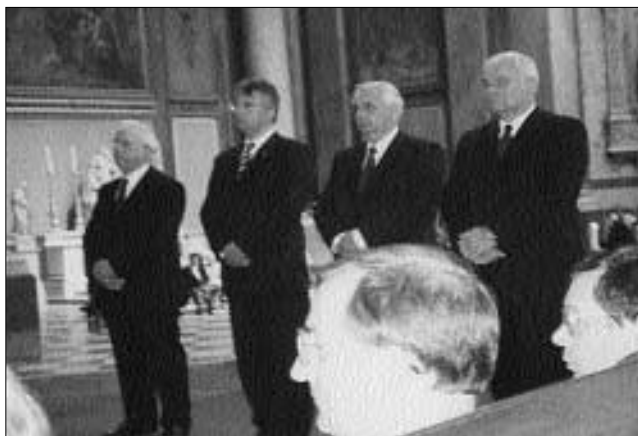
Mi, kereszténydemokraták, nyíltan vállaljuk hitünket (A Szent Adalbert-díj átvétele az esztergomi bazilikába, 2002)

Az államtitkári választ helyére teszi az idő. Csak ki kell mennie az utcára annak, akit érdekel, hol az igazság.