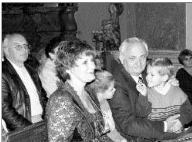
Arika kiállításának megnyitóján a vízivárosi Szent Anna-plébánia-templomban, 2007. szeptember 15-én