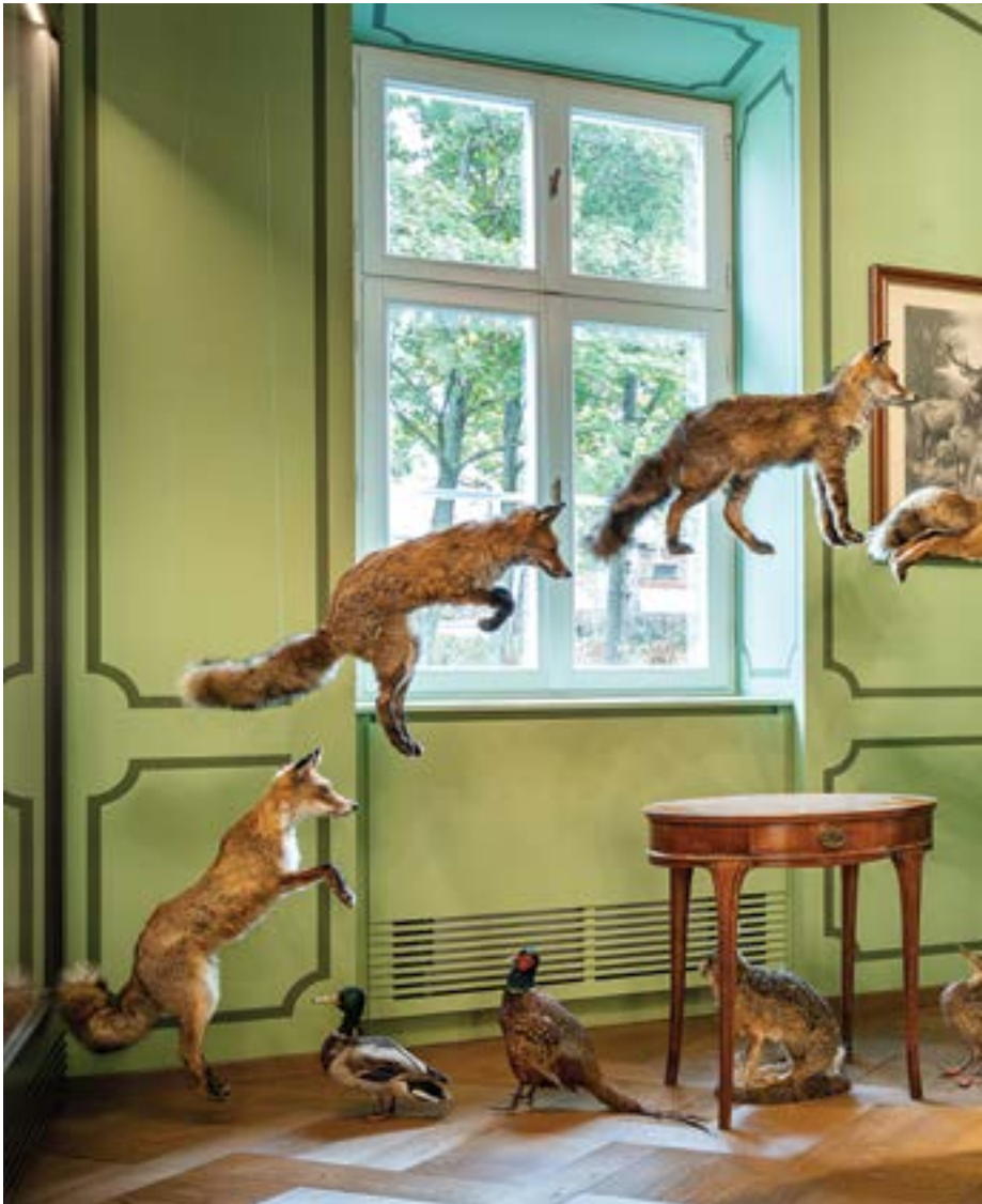
Zsolt Vasáros: Camera vânătorului