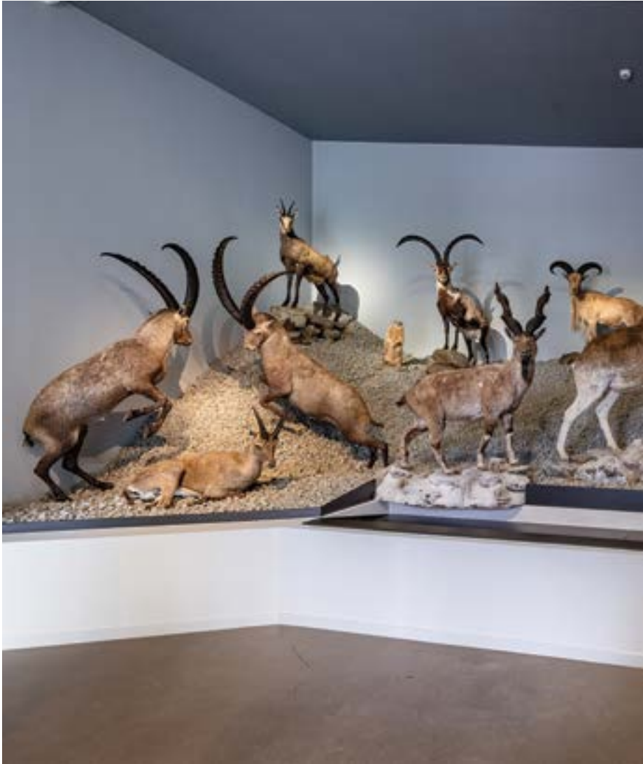
Zsolt Vasáros: Plai alpin