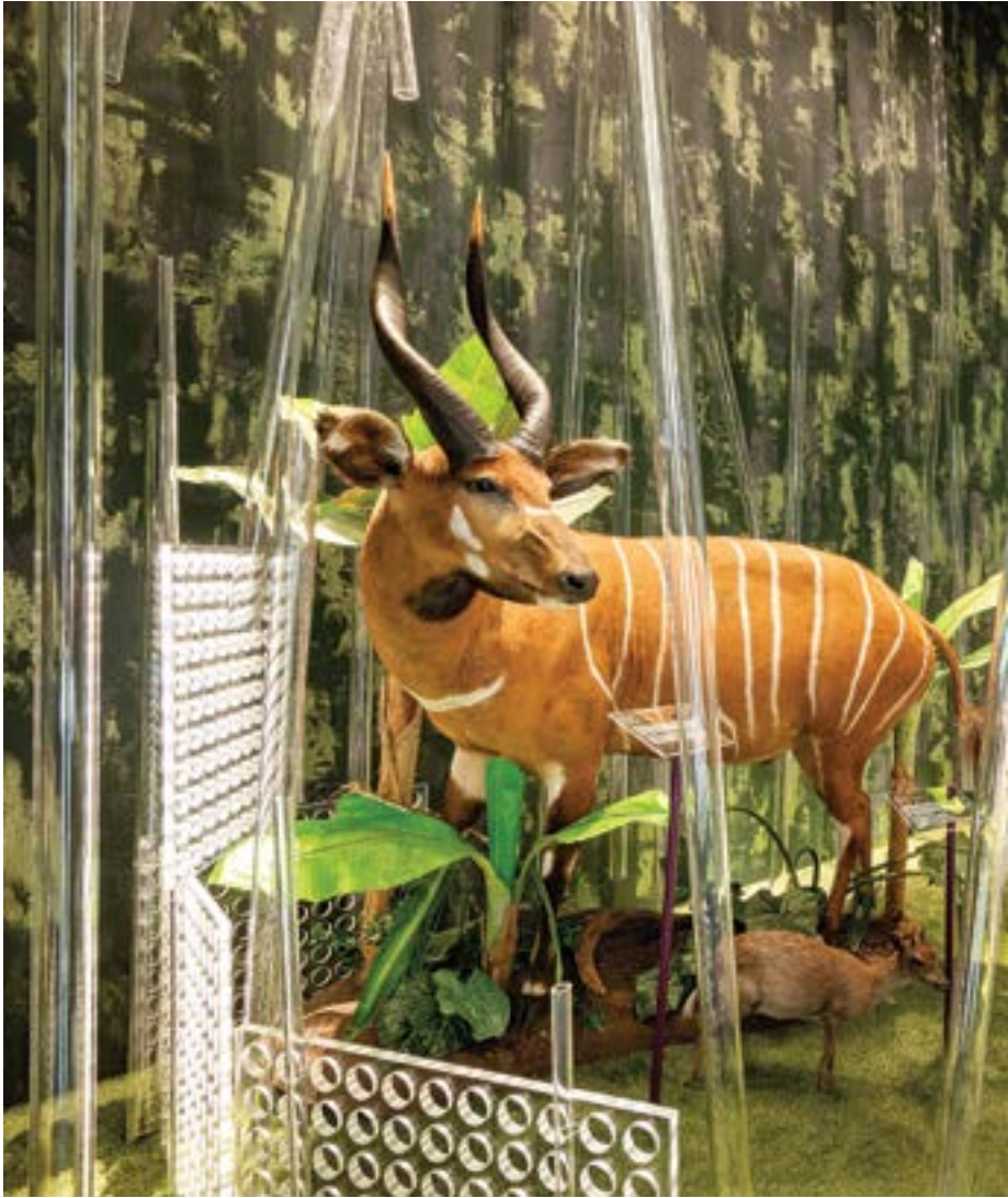
Zolt Vasáros: Junglă