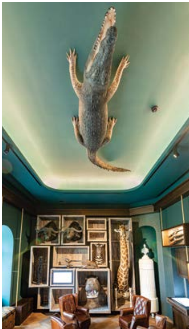
Zsolt Vasáros: Salon pentru fumat