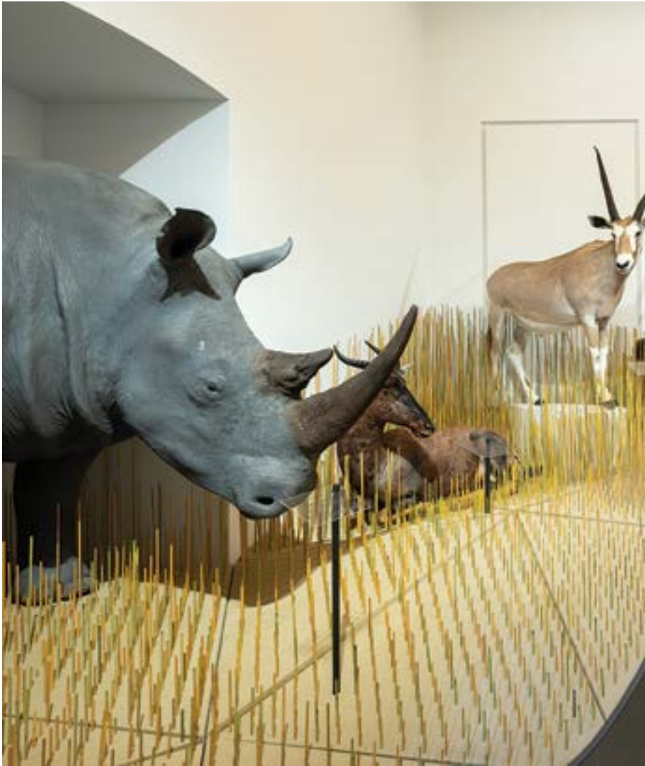
Zsolt Vasáros: Savană