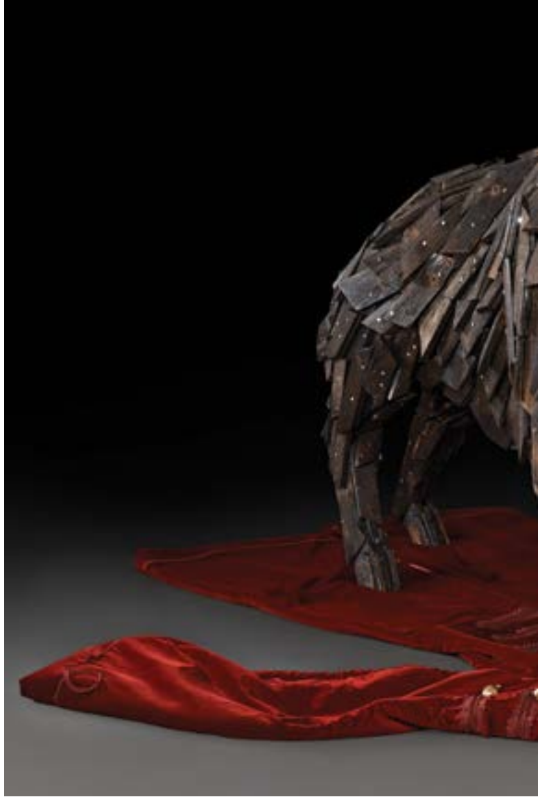
Gábor Miklós Szőke: Moartea lui Zrínyi 1