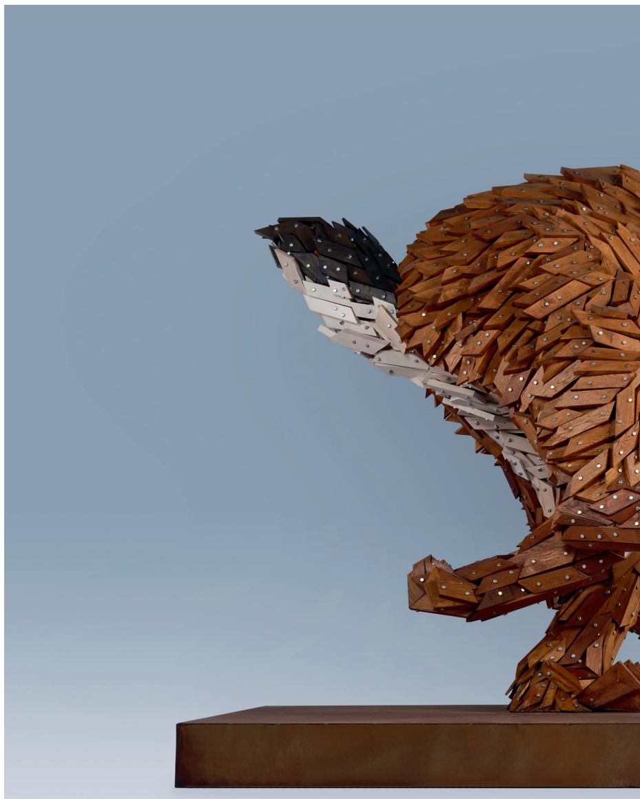
Габор Миклош Секе: Гоњење