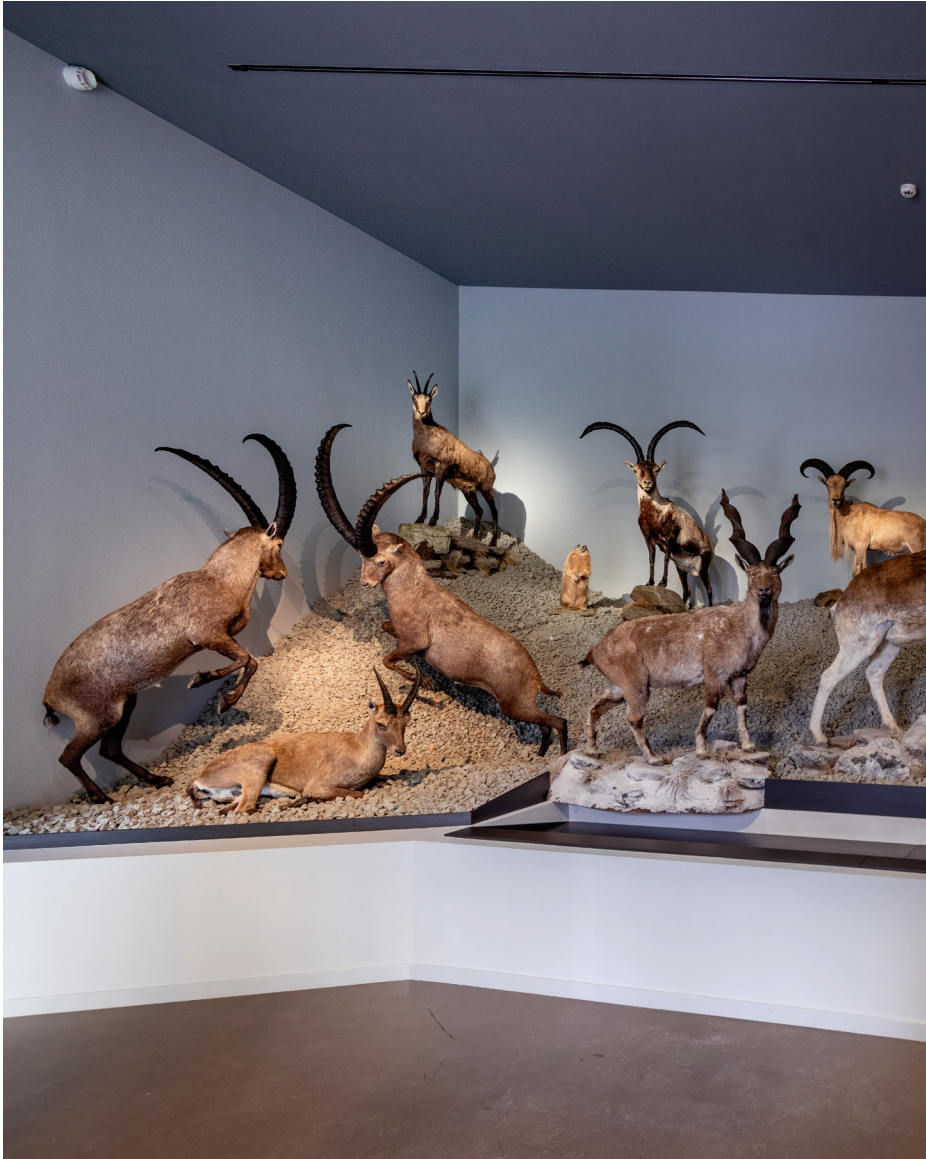
Жолт Вашарош: Висока планина