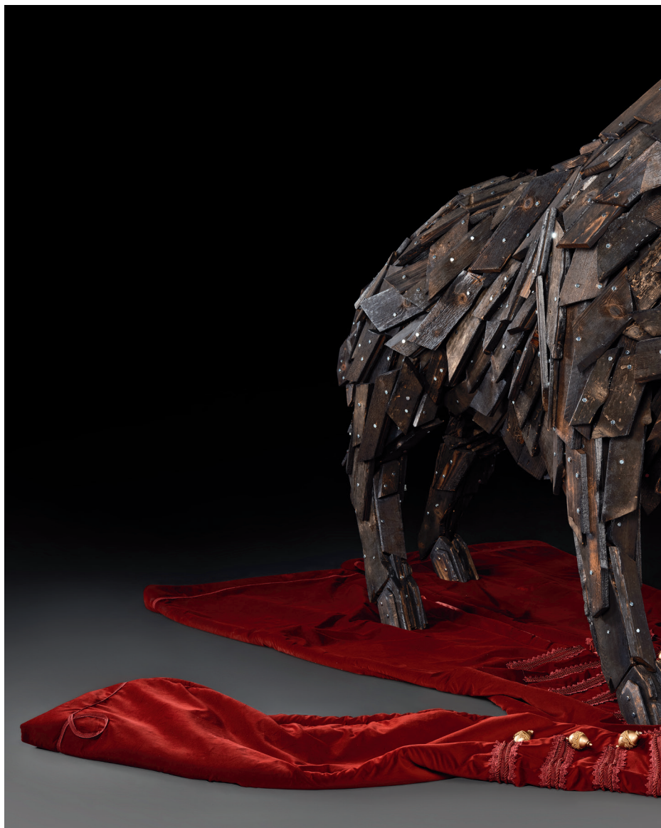
Габор Миклош Секе: Смрт Зрињског