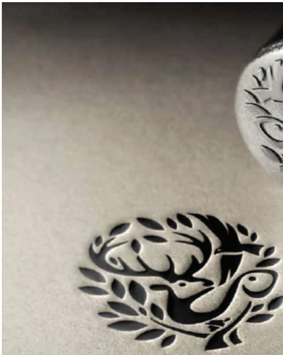
Ускладу са природом