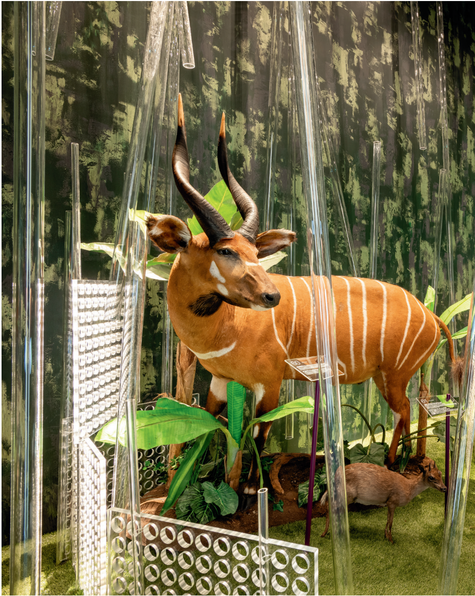
Жолт Вашарош: Цунгла