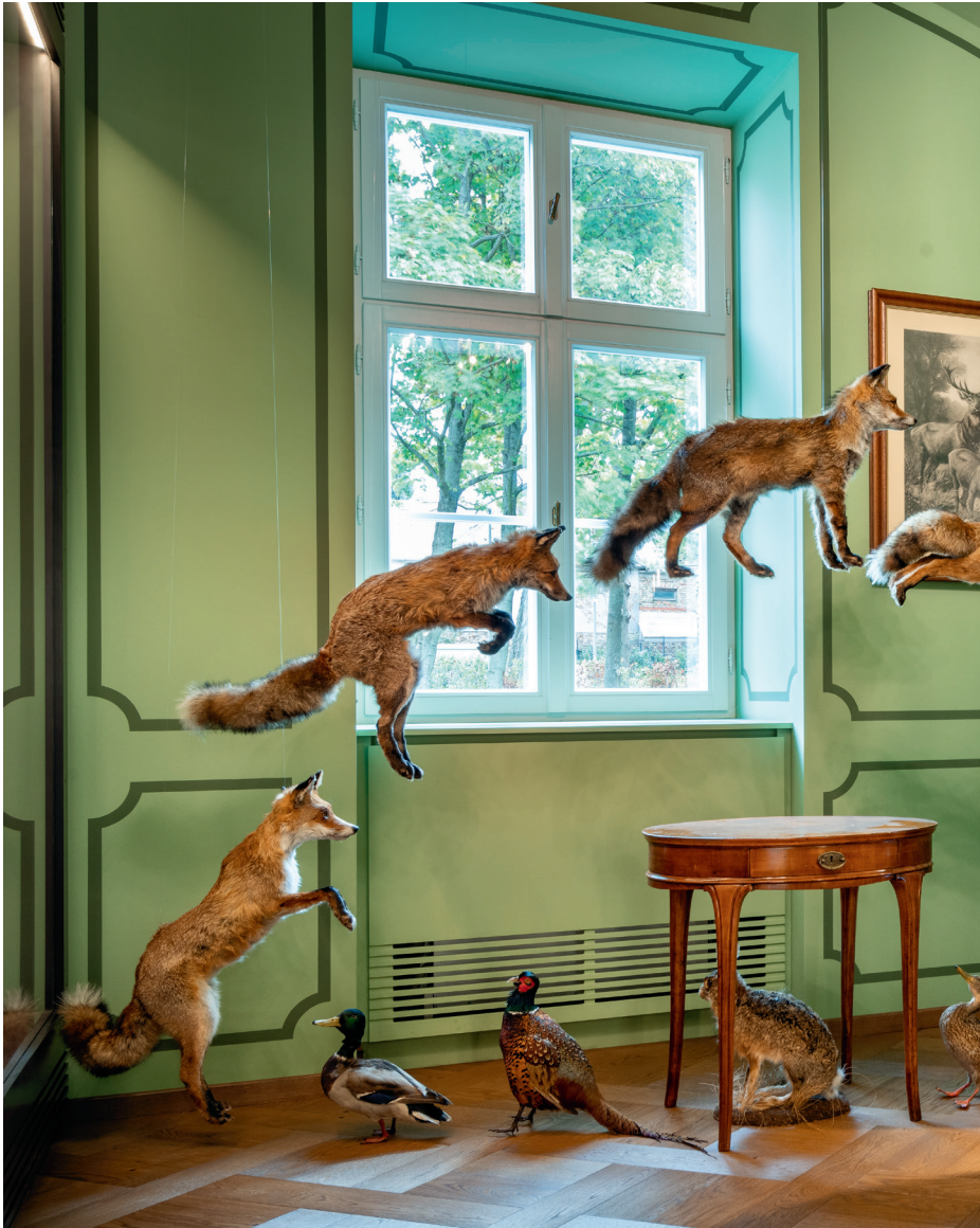
Жолт Вашарош: Ловачка соба