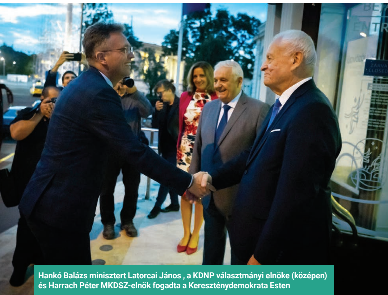
Hankó Balázs minisztert Latorcai János, a KDNP választmányi elnöke (középen) és Harrach Péter MKDSZ-elnök fogadta a Kereszténydemokrata Esten