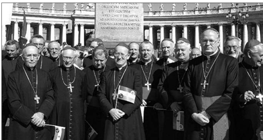
A Magyar Katolikus Püspöki Konferencia Rómában

gyunk, nacionalisták és sovíniszták. Ehhez újabban a kirekesztő és a rasszista jelzót is hozzátesszük. Mindezeket a szeretettel ellenkező magatartásokat határozottan elutasítjuk. Szükséges és jogos, hogy helyes öntudatra ébredjünk, keressük, újra tudatosítsuk igazi értékeinket, magyar örökségünket kulturális, történelmi és tu-