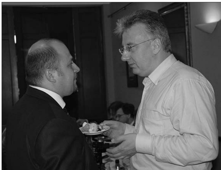
Semjén Zsolt Olosz Gergely felsőháromszéki képviselőkkel